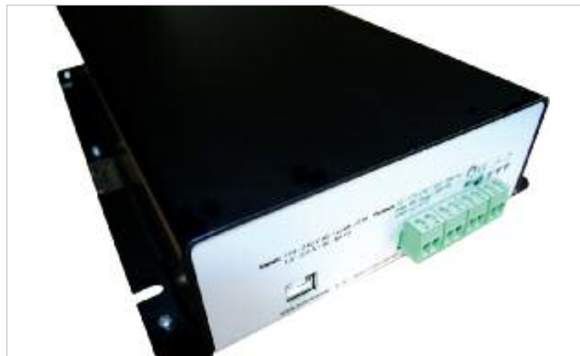
Abbildung 2: Inverter EL Manager 500W